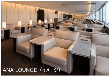
ANA LOUNGE (イメージ)